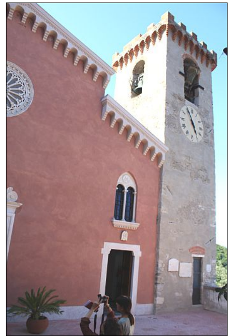
La facciata e la torre campanaria della parrocchia di san Vincenzo martire dopo il restauro