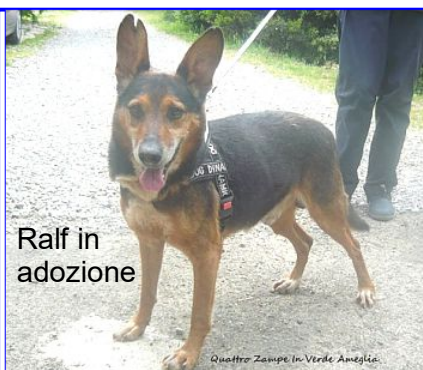
Ralf in adozione