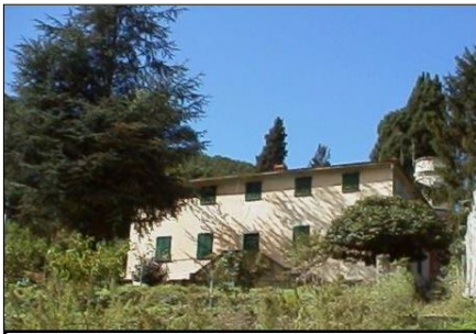
Villa Tixi com'è oggi

(Continua da pag. 8) (Paganini ad Ameglia)