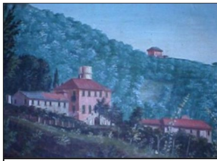
Villa Tixi come era nell'800

Pare che anche duecento anni fa Ameglia avesse i suoi concerti estivi. Certo non si trattò di musica di tendenza ma di suoni soavi provenienti dal «palazzo», sull'altura di Migliazzola.