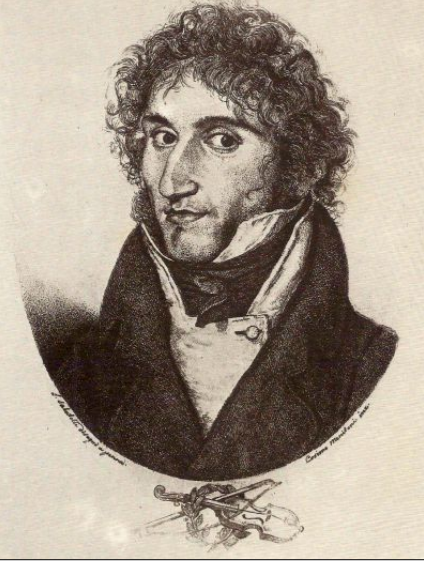
Paganini nel 1814: disegno a penna di Luigi Sabbatelli

Germi lo aiutò con saggi consigli anche quando fu accusato del rapimento e della seduzione di Angela Cavanna, una giovane che per qualche tempo aveva convissuto con lui more uxorio . Non fu l'unico suo guaio giudiziario: a Venezia nel 1817 fu denunciato per non