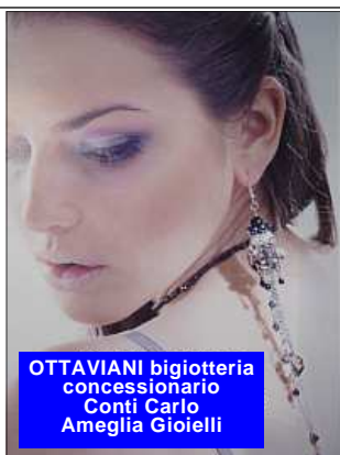
OTTAVIANI bigiotteria concessionario Conti Carlo Ameglia Gioielli