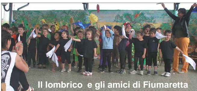
Il lombrico e gli amici di Fiumaretta

La festa di fine anno scolastico alla scuola materna di Fiumaretta si è svolta il 14 giugno e aveva il titolo: "Il lombrico Federico e i suoi amici dell'orto".