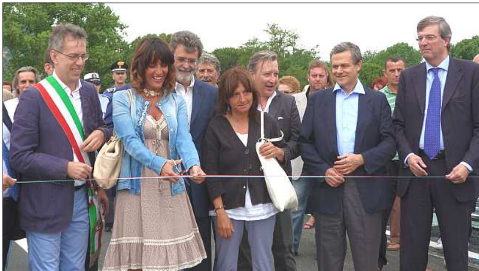
Da sinistra il sindaco di Ameglia Umberto Galazzo con a fianco l'assessore regionale Raffaella Paita che taglia il nastro di inaugurazione del nuovo ponte della Colombiera e all'estrema destra il presidente della Regione Liguria Claudio Burlando.

29 giugno 2013 - Sembra un sogno, ma questa volta è proprio vero, dopo quel tragico 25 ottobre 2011 che l'alluvione si portò via il ponte della Colombiera, Ameglia e Fiumaretta sono di nuovo unite e tutti possono tirare un sospiro di sollievo dopo quasi due anni di rassegnazione e d'isolamento.