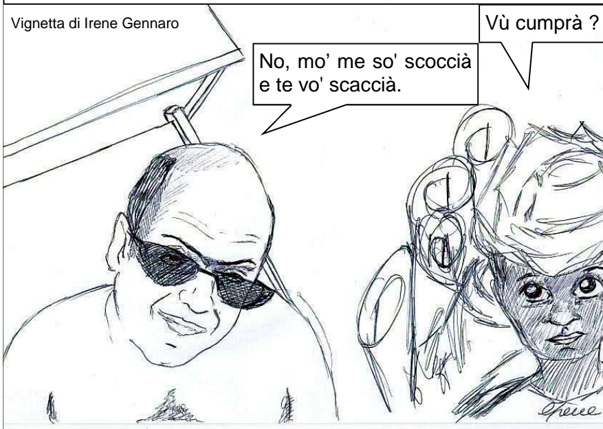
PHOTO & GOLD