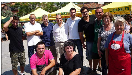
Il sindaco, l'assessore, e i produttori presenti al mercato del 10 agosto

Già da alcune settimane tutte le domeniche , a seguito della chiusura del punto vendita di frutta e verdura a Fiumaretta e della chiusura del supermercato "Il Centro" di Ameglia, ma non solo, per iniziativa del Comune di Ameglia e dell'associazione Vivere Fiumaretta, è partito in piazza Pertini a Fiumaretta il mercatino a Km 0 dei produttori agricoli locali.