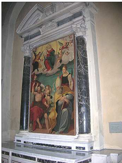
Cappella di S. Giovanni nella chiesa parrocchiale di San Pietro

Nella lunga storia di Montemarcello e del suo ruolo in Lunigiana [a partire dall'essere stato l'ultimo - e per due secoli insuperabile - limite all'espansione romana (sino al 155 A.C. quando il console Marcello conquistò il Caprione) per merito del coraggio e capacità guerriera dei suoi abitanti], una posizione importante l'ha avuta la famiglia Remedi.