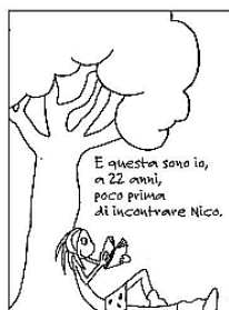
I protagonisti della storia

sofferenza, e ci spiega come in questa sua graphic novel (storia a fumetti) di cui non vi sveliamo il finale.