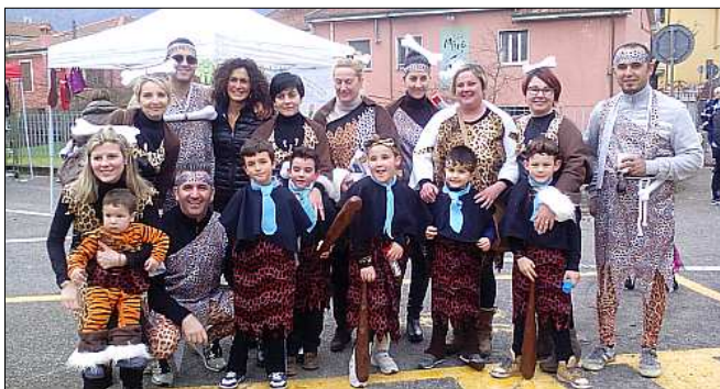
Domenica 1° marzo, grazie all'associazione "I Vagabondi Animation & artist" il Cafaggio si è animato con un carnevale ispirato ai "Flintstones" (in foto). Una festa pienamente riuscita con l'aiuto di volontari e commercianti.