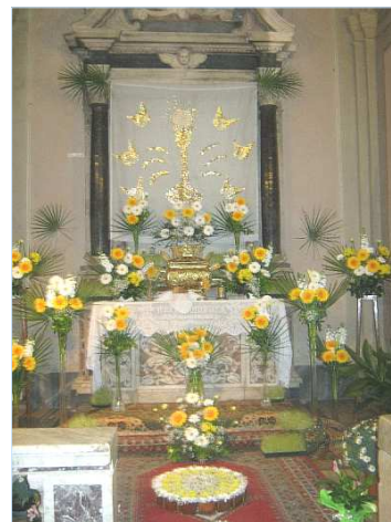
Il sepolcro del Giovedì Santo nella chiesa di San Pietro a Montemarcello