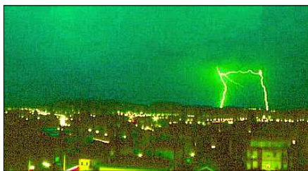
Fulmini insoliti presso il Caprione

tenta il Buddha. Un termine simile si ritrova anche in Cina, nonché nella lingua greca, come "moros", con richiamo alla morte.