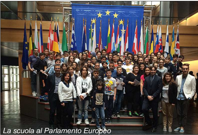
La scuola al Parlamento Europeo

Strasburgo, ricco di numerosi monumenti e luoghi di interesse, come la Cattedrale di Notre Dame, capolavoro dell'architettura gotica: alta ben 142 metri, ha impressionato profondamente i ragazzi per la sua mole e la sua bellezza. La visita alla capitale europea è continuata nel pomeriggio, con una rilassante gita in battello lungo il fiume Ill, affluente del Reno che attraversa