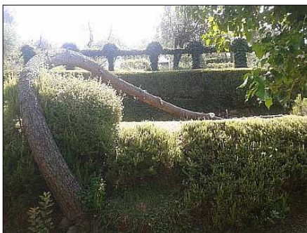
Il pino curvo della Marrana

alle grandi faglie con cui in tempi antichissimi si è aperto il Mar Tirreno, hanno però lasciato una traccia di un pino curvo nel sito della Marrana a Monte Marcello.