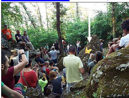
La farfalla dorata (21 giugno)