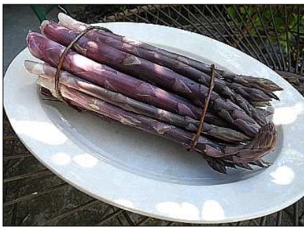
Asparago Violetto di Albenga

Oggi vi parlo dei Presidi Slow Food della Liguria, si perché anche la nostra bella terra ha dei prodotti che sono stati insigniti di questa importante certificazione e sono ben quattordici: