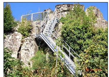
La Brina - Carrara

WWW.FERALSP.COM TEL. 0187-933658 CARPENTERIA METALLICA