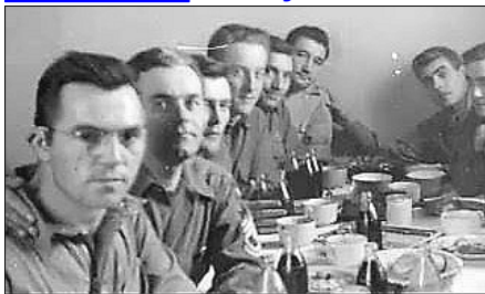
I componenti della missione Ginny