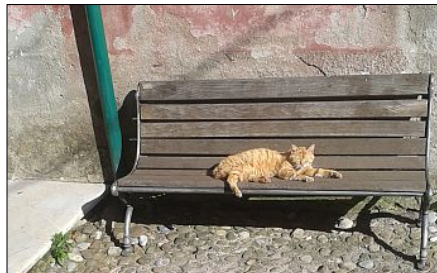
A Montemarcello anche i gatti sono felici