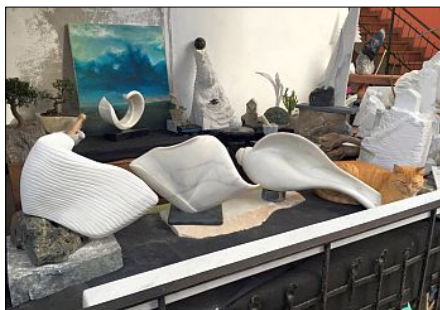
UN INTRUSO si aggira tra le opere di Daniele: scoprite chi è (soluzione a p.10)

Espositore nel 2013 alla biennale d'arte contemporanea di Brescia, nel 2014 alla biennale d'arte contemporanea di Novara e nel 2015 partecipante al Simposio internazionale di scultura di Carrara.