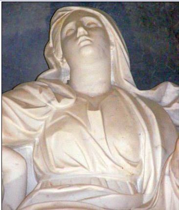
Immagine marmorea dell'Assunta