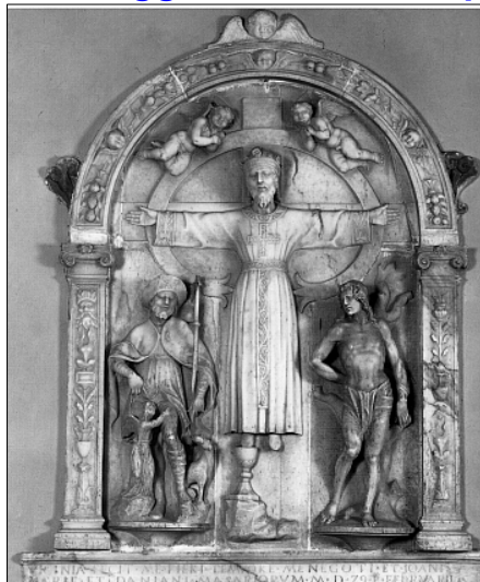
Chiesa di S. Pietro, D. Gare, Volto Santo di Lucca e i santi Rocco e Sebastiano, 1529

La prima tappa della presentazione del libro "Passeggiata con vista - Alta via del Golfo" (Edizioni Cinque Terre), come preannunciato il mese scorso, si è svolta il 15 luglio a Montemarcello nella raccolta cornice di piazza Vittorio Veneto, col silenzioso Palazzo Magni e il garrire delle rondini che attraversavano la piazza sorvolando i piccoli nel nido nascosto nell'intimità di via Guardiola. La serata organizzata su proposta del Club Alpino Italiano sezioni La Spezia e Sarzana, dalla Pro Loco di Montemarcello e da La Marana arteambientale, ha a-