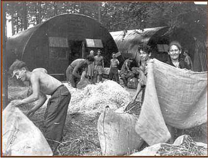
1947 - La "colonia climatica" per l'esodo degli ebrei da Fiumaretta

Ada Sereni , nata Ascarelli (Roma 1905 - Gerusalemme 1997) è stata un'esponente del movimento sionista e fu, insieme al marito Enzo, una fra i primi ebrei italiani a emigrare in Palestina nel 1928 per costruire la sempre agognata Eretz Israel (Terra d'Israele). Qui fondò il kibbutz Givat Brenner, uno dei maggiori d'Israele.